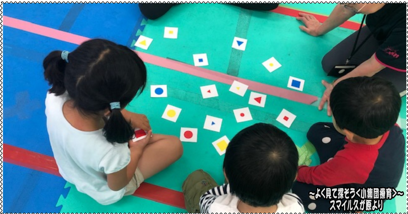
～よく見て探そう小集団療育～ スマイル久が原より

発行：株式会社スマイルキッズ 通信編集委員会 住所：東京都大田区南久が原2-12-14 三立ビル1F 電話：03-6715-2370 ●発達支援教室スマイル千鳥 ●発達支援教室スマイル久が原 ●発達支援教室スマイル久が原プラス ●移動支援事業所スマイルアクティブ