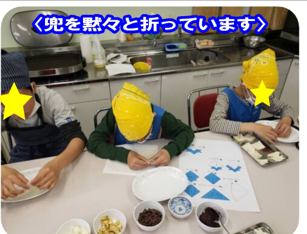
「兜を黙々と折っています」

春巻き、その中にバナナやあんこ、チーズを詰めて油で揚げました。春巻きの皮を折り紙に見立てて、とても上手に折っていました。揚げるとより兜らしくなり、子どもたちもとても喜んでいました！