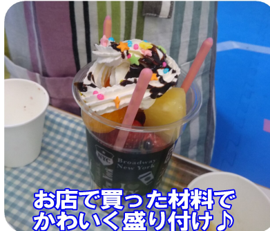
お店で買った材料でかわいく盛り付け♪

久が原駅近くの公園で色とりどりのお花を発見しました。スマイルに戻ってからは、「こんな色のお花があったね！」と外で見つけたお花を思い浮かべながら、大きな模造紙いっぱい思い思いの花を咲かせることが出来ました。