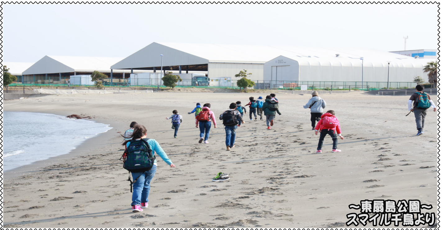
～東扇島公園～ スマイル千鳥より

発行：株式会社スマイルキッズ 通信編集委員会 住所：東京都大田区南久が原2-12-14 三立ビル1F 電話：03-6715-2370 ● 発達支援教室スマイル千鳥 ● 発達支援教室スマイル久が原 ● 発達支援教室スマイル久が原プラス ● 移動支援事業所スマイルアクティブ