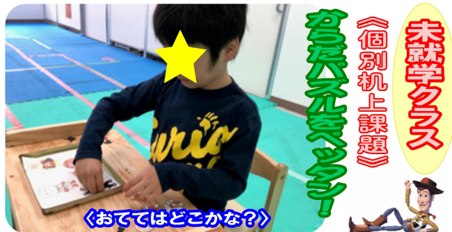
「おててはどこかな？」

頭・手・足・からだに分かれたキャラクターパズルに取り組みます。見本と同じキャラクターのパーツを探して、「あたま、ここ！」と元通りに貼っていきます。右手のパーツを左手に貼りそうになることもあります。「あれ？」と形が違うことに気付く大切な機会です。そこから「これどこ？」と先生に確認する様子もみられます。一生懸命がんばったね☆