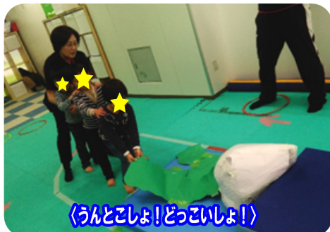
「うんとこしょ！どっこいしょ！」

「うんとこしょ！どっこいしょ！」と声を掛けながら、力を合わせて引っ張りました。次はかぶと一緒にマットに乗ったお友達も引っ張ります。「抜けるかな？よいしょ！」と先生と力を合わせながら引っ張り、関わりを深めながら自然と笑顔が溢れます。