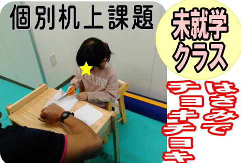
個別机上課題 未就学クラス チョコチョコ

紙をビリビリと破る音や感触を楽しんだ後は、はさみで切ることへの興味が始まります。利き手ではさみを握り、支持の手で紙を押さえながら切っていきます。「チョコチョコ」と自分で切れるの楽しいね！ 洗濯ばたきパッチン 指先で洗濯ばたきを持って、箱にパッチンと付けていきます。指先への力の入れ方を体感しながら、色ごとに付けていくのを楽しみます。全部付けたら「できたよ！」と笑顔でいっぱいです☆