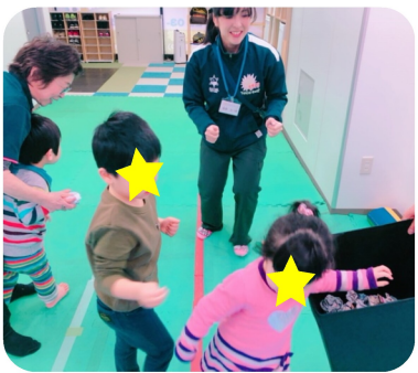
＜皆で紙を丸めよう＞