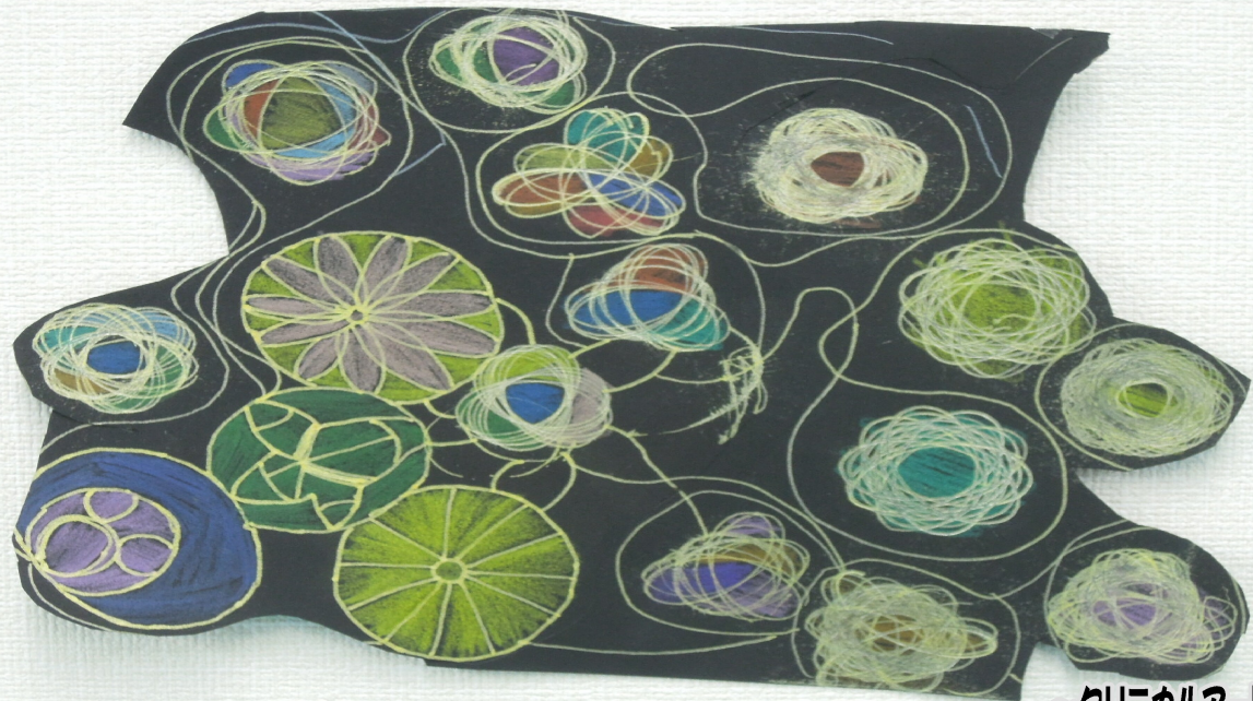
～クリニカルアート～ スマイル久が原プラスより

発行：株式会社スマイルキッズ 通信編集委員会 住所：東京都大田区南久が原2-12-14 三立ビル1F 電話：03-6715-2370 ● 発達支援教室スマイル千鳥 ● 発達支援教室スマイル久が原 ● 発達支援教室スマイル久が原プラス ● 移動支援事業所スマイルアクティブ