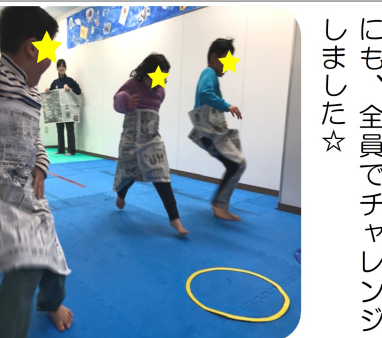
短い距離からスタートし、段々と長い距離を走り続けることが出来るようになりました♪最後には新聞紙をバトンにしたりもしました☆

フルな材料たちでかわいくデコレーションをしました。いつもよりもスペシャルな味なおやつを、皆で美味しくいただきました♪ 〈霞〉