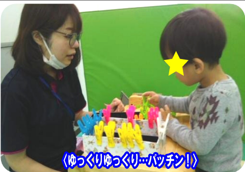
＜ゆっくりゆっくりパッチン＞

小集団 他者との関わりを増やしていくことを目的として、手つなぎ体操をします。お友達と身体を近づけたり、くるくると回りながら、心地よい距離感を見つめます。へ皆で小さく固まるよ」とお友