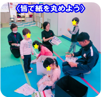
＜皆で紙を丸めよう＞

達と身体を近づけると、「わあ、ちっちゃくなつた〜！」と笑顔がこぼれます。手をつなぐ中でお友達に興味をもち、お名前を呼びかけにもなっています。また、五感で紙の感触を味わうために、追いかけて玉入れをしました。紙をビリビリと破く音や、くしゃくしゃと丸めていく感触を楽しみながら紙玉を作ります。最後は皆で協力して、先生が持つ箱に紙玉をポイポイ！ぜんぶ入ってよかったですね！